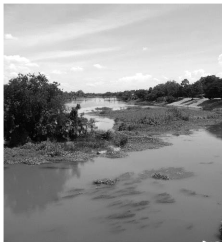
รูปที่ 2 สภาพแม่น้ำแม่กลองช่วง M4 อำเภอบ้านโป่ง จังหวัดราชบุรี

(ซ้าย) ภาพถ่ายทางอากาศเกาะกลางแม่น้ำกิโลเมตร 76 (ขวา) ตัวอย่างเกาะกลางแม่น้ำแม่กลองพื้นที่ศึกษาช่วง M4