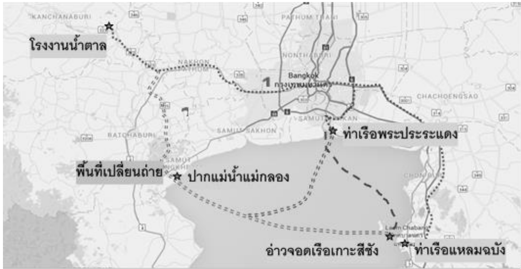
==== รูปแบบการขนส่งที่นำเสนอ - - - - - รูปแบบการขนส่งปัจจุบัน รูปที่ 3 แผนที่แสดงจุดต้นทาง-ปลายทางในการวิเคราะห์