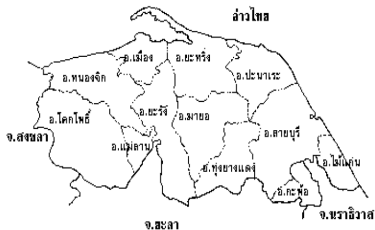
ภาพที่ 4.1 ที่ตั้งและอาณาเขตของจังหวัดปัตตานี

ปัตตานีเป็นจังหวัดที่มีบริบททางด้านกายภาพหรือสภาพภูมิศาสตร์เป็นพื้นที่ราบติดชายฝั่งทะเล ซึ่งเป็นพื้นที่ส่วนใหญ่ ของพื้นที่จังหวัด ได้แก่ทางตอนเหนือและทางตะวันออกของจังหวัด มีหาดทรายยาว และเป็นที่ยืนของชายฝั่งกว้างประมาณ 10-30 กิโลเมตร พื้นที่ราบลุ่มบริเวณตอนกลาง และตอนใต้ของจังหวัด มีแม่น้ำปัตตานีไหลผ่านที่ดินมีความเหมาะสมในการเกษตรกรรม และพื้นที่ภูเขา ซึ่งเป็นพื้นที่ส่วนน้อยอยู่ทางตอนใต้ของอำเภอโคกโพธิ์ อำเภอเกาะพ้อ และทางตะวันออกของอำเภอสายบุรีลักษณะชุมชนเป็นชุมชนชนบทมากกว่าชุมชนเมือง ส่วนชาติพันธุ์จะมีลักษณะผสมระหว่างชาวมลายูและชาวไทย และอาจจะมีแรงงานจากพื้นที่อื่นๆผสมมากขึ้น เช่น จากจีน จากพม่า เขมร เป็นต้น ในด้านการประกอบอาชีพเนื่องจากพื้นที่ทางกายภาพของปัตตานีอยู่ติดทะเลและป่าเขาที่มีความอุดมสมบูรณ์ ทำให้อาชีพส่วนใหญ่ จะทำการประมง ทำสวนยางพารา และสวนปาล์ม น้ำมัน ส่วนในด้านสังคมและวัฒนธรรม ผู้คนส่วนใหญ่ในจังหวัดปัตตานีมีความเชื่อและนับถือศาสนาอิสลาม โดยส่วนใหญ่จะเป็นมุสลิมโดยสายเลือดจึงจะมีความเคร่งครัดในคำสอนและหลักศาสนา โดยหลักการปฏิบัติในทุกๆด้านล้วนแต่จะนำไปใช้ตามหลักคำสอนของศาสนาทั้งสิ้น ไม่เว้นแม้แต่รูปแบบการวางโครงสร้างการบริหารการศึกษา โดยสิ่งสำคัญต้องมีการบูรณาการศึกษาคบคู่กันระหว่างศาสนาและสามัญ แต่อยู่ภายใต้นโยบายและแผนการศึกษาจากส่วนกลาง